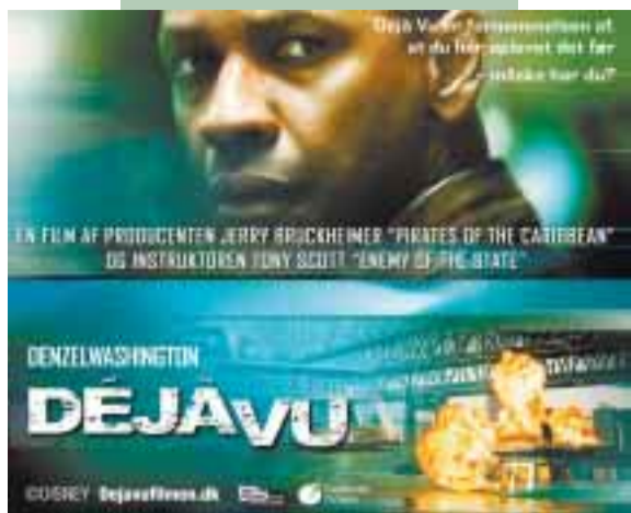
19. Jan. – 25. Jan. DèJa Vu Thriller