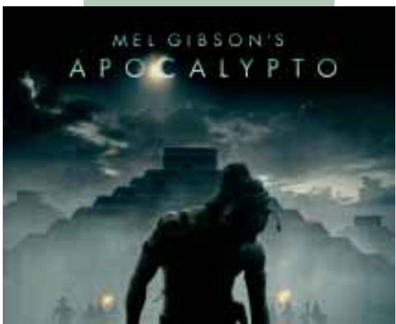
23. Feb. – 01. Marts Apocalypto Action – Drama