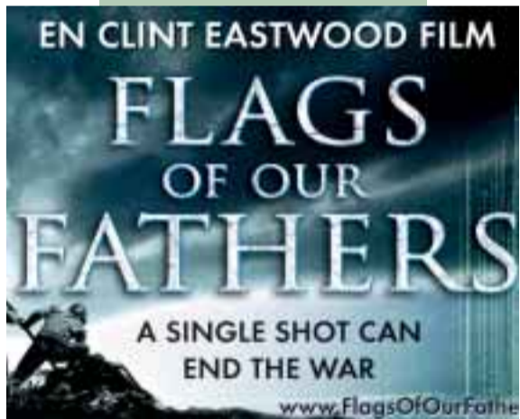
26. Jan. – 01. Feb. Flags of Our Fathers Action – Drama - Krigsfilm