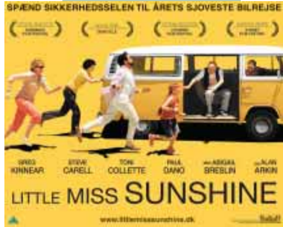
12. Jan. – 18. Jan. Little Miss Sunshine Adventure – Drama – Komædie