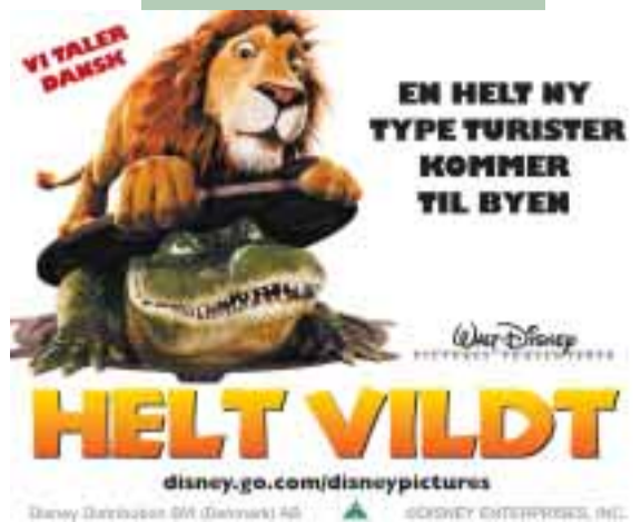
30. Dec. – 11. Jan. Helt Vildt Animation – Komædie