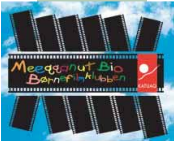
17. Marts. Børnefilmklubben