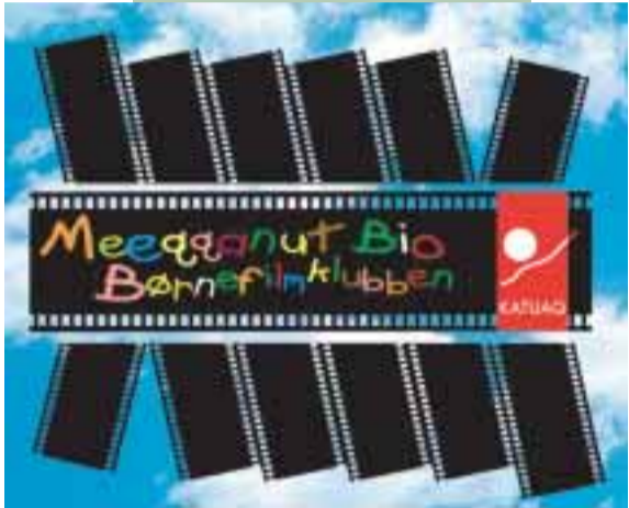
10. Feb. Børnefilmklubben