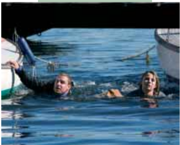
09. – 22. marts Den Sorte Madonna Actionkomædie Premierefilm