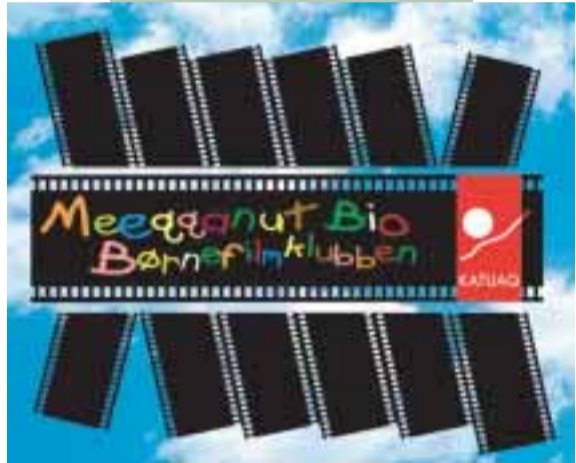
21. Jan. Børnefilmklubben