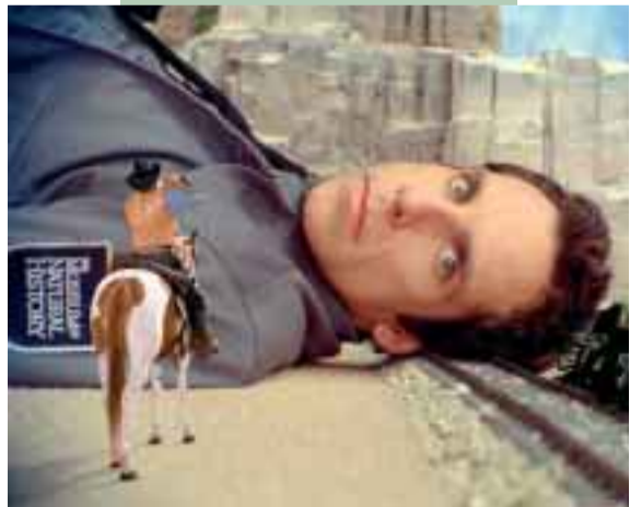
09. Feb. – 22. Feb. Night at the Museum Action – Adventure – Komædie Premierefilm